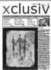
Auch ein Produkt aus dem Jahr 2005: europa xclusiv 2, erschienen zum Tag des Flüchtlings 2005.

Die nächsten Innenministerkonferenzen finden am 4./5. Mai in Garmisch-Partenkirchen und am 16./17. November in Nürnberg statt.