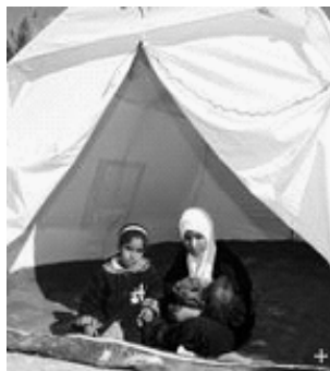
Irakische Flüchtlinge in einem Zeltlager bei Bagdad

Nach der Entscheidung der EU-Innenminister, vor einer Aufnahme von irakischen Flüchtlingen zu prüfen, ob diese nicht doch in ihre Heimat zurückkehren können, hat Bundesinnenminister Schäuble diesen Beschluss verteidigt. Beim Wiederaufbau des Irak seien alle Iraker gefragt. Außerdem würde es deutliche Fortschritte bei der Sicherheit geben. Deutschland würde aber wie bisher Iraker über reguläre Asylverfahren aufnehmen.